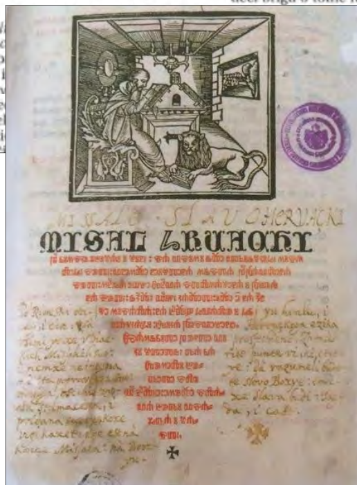
Naslovnica pretiska Misala hruackog iz 1531.

jem je astojao univerzabdom ku tralazio u adru, a gdje je posred- ana je-