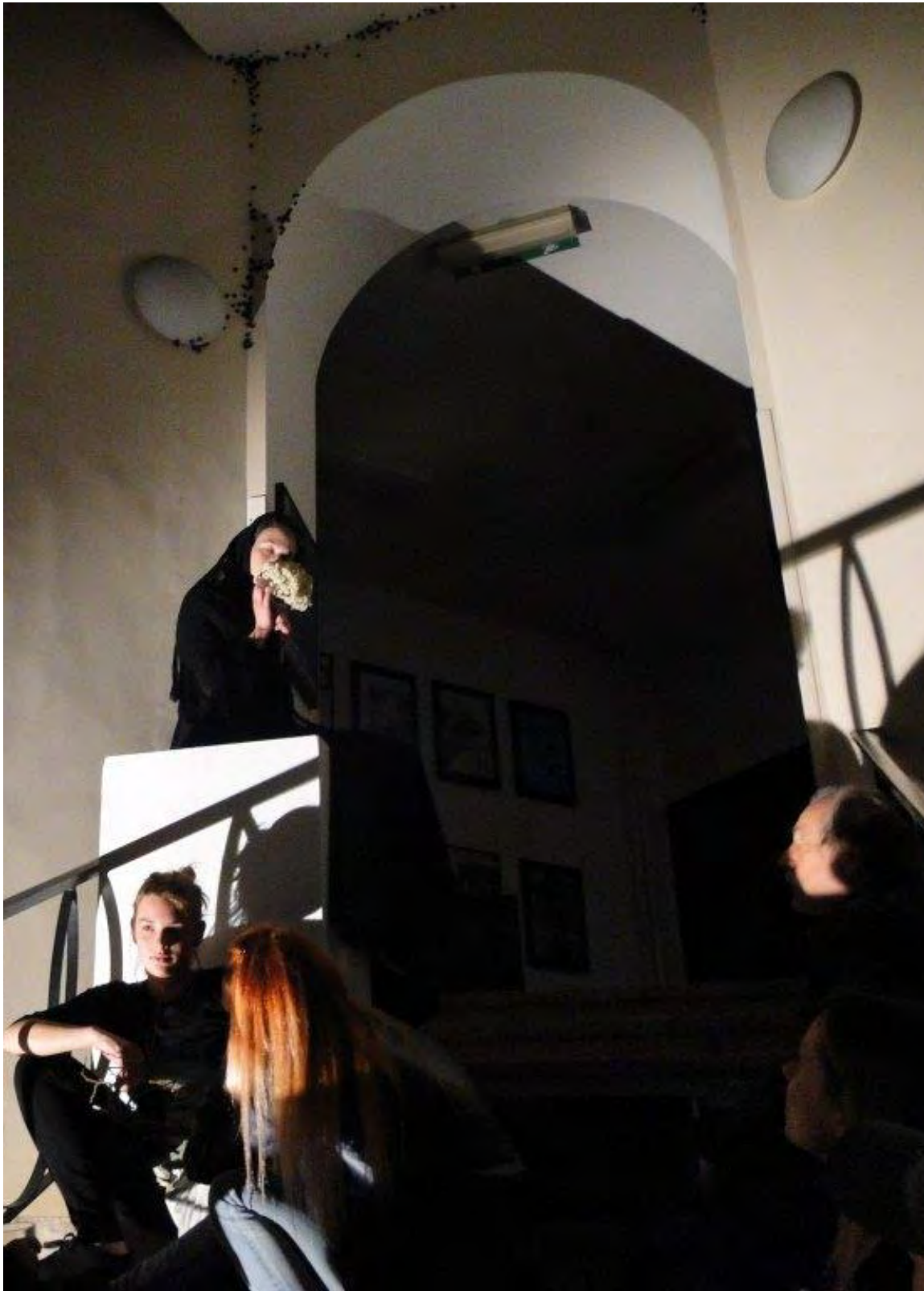
Noć knjige u Sveučilišnoj knjižnici 2016.